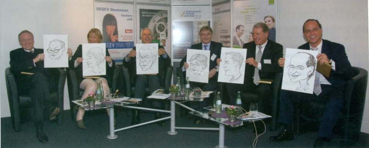
Besonderes Abschlussgeschenk: Alle Teilnehmer der Talkrunde erhielten ihre persönliche Porträt-Karikatur.